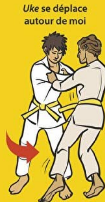
Uke se déplace autour de moi