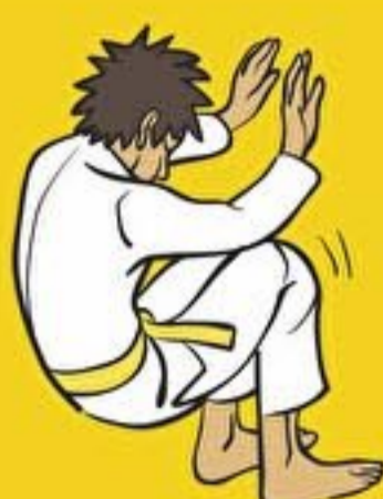
Je sais chuter en arrière Ushiro-ukemi