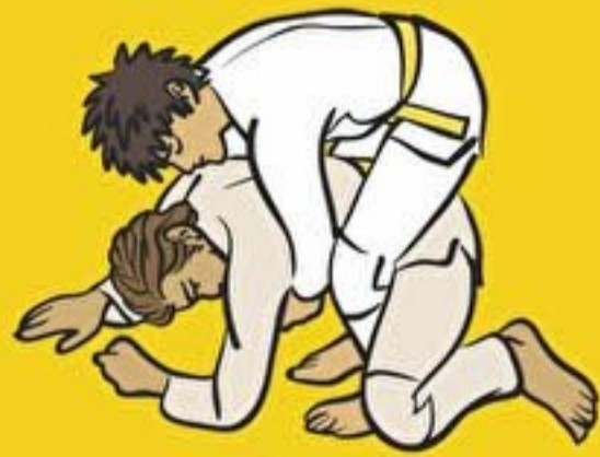
Uke est à quatre pattes

A partir de ces situations je contrôle mon partenaire en faisant une immobilisation.