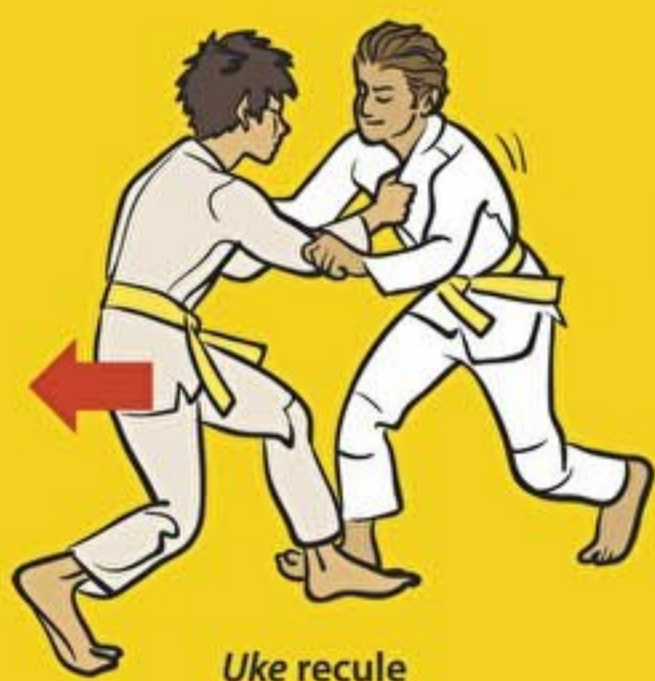
Uke recule en me tirant

A partir de ces situations je sais faire des techniques.