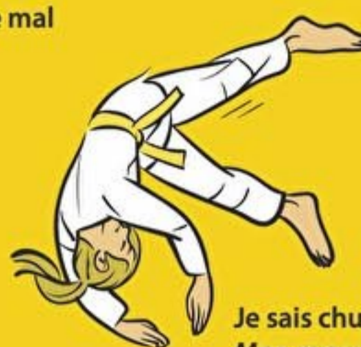
Je sais chuter en avant Mae-mawari-ukemi