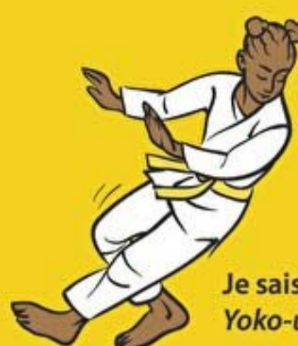
Je sais chuter sur le côté Yoko-ukemi