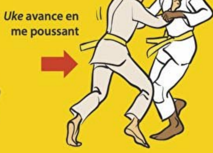
Uke avance en me poussant