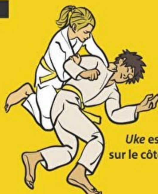
Uke est sur le côté