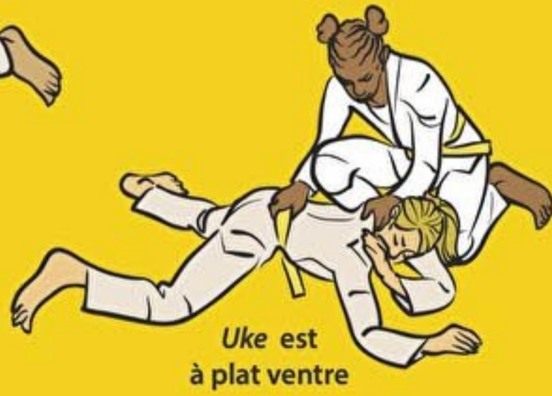
Uke est à plat ventre