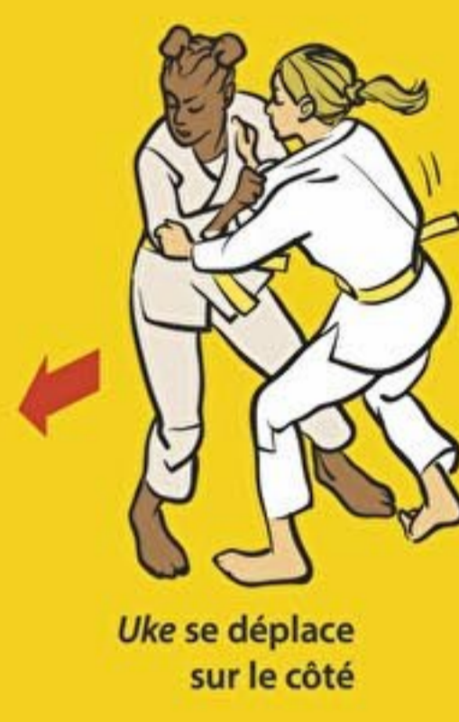
Uke se déplace sur le côté